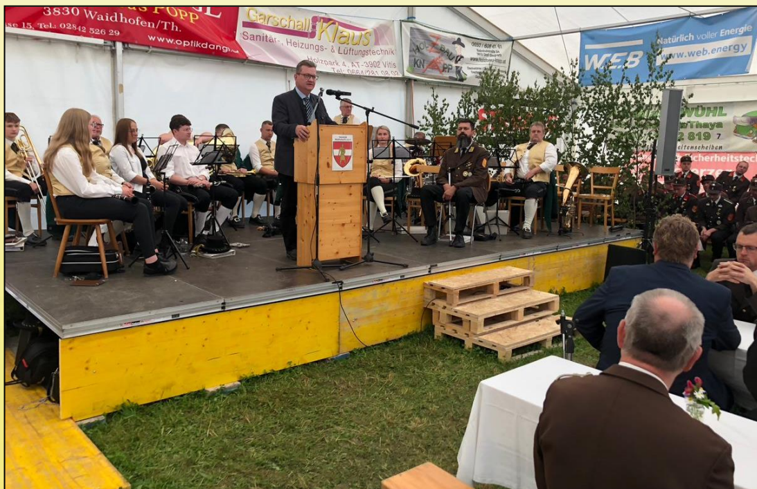
Bericht im Blattinneren